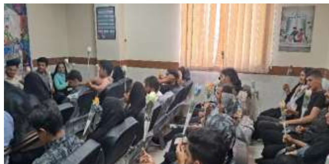
برگزاری کارگاه و همایش شهرستانی با موضوعات مختلف در نقاط مختلف استان در طول هفته ی جمعیت