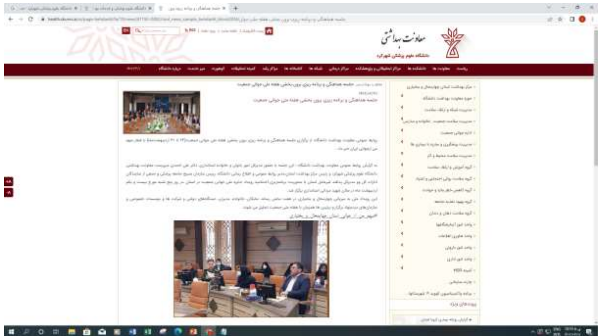
تشکیل جلسات درون بخشی و برون بخشی هفته ملی جمعیت در تام شهرستان های استان