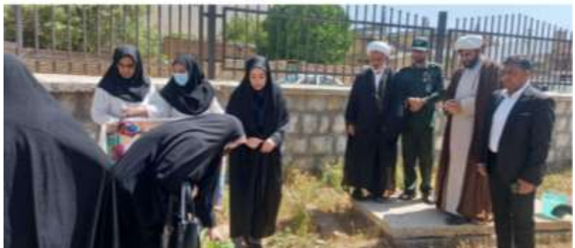
برگزاری غرفه جوانی جمعیت در حاشیه همایش ها و کارگاههای برگزار شده در استان