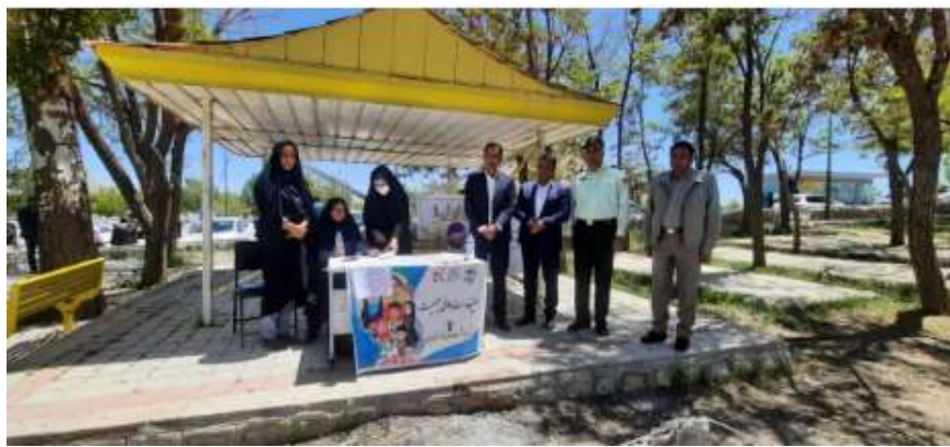
سخنرانی پیش خطبه های نماز جمعه با موضوعات جوانی جمعیت و اهمیت فرزند آوری