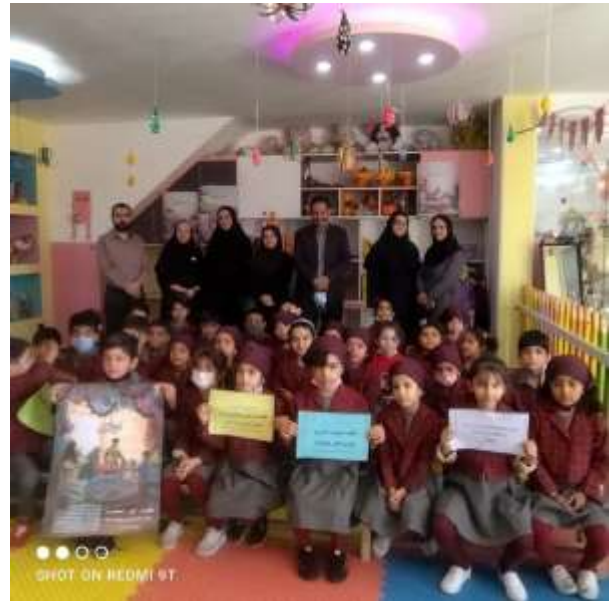
بازدیدمدیرگروه سلامت جمعیت خانواده ومدارس وکارشناس جوانی جمعیت از مرکز مشاوره هنگام ازدواج