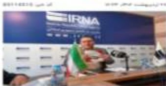
شهرکرد - ایرنا- معاون بهداشت دانشگاه علوم پزشکی چهارمحال و بختیاری و رئیس مرکز بهداشت