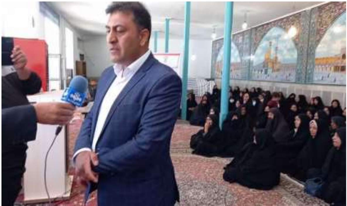
اهدای جوایز و تجلیل از اساتید، دانشجویان و کارکنان ازدواج کرده یا صاحب فرزند شده در سال ۱۴۰۱ با هدف اجرای ماده ۲۰ قانون حمایت از خانواده و جوانی جمعیت در یکی روزهای هفته ملی جمعیت و انعکاس در رسانه های محل