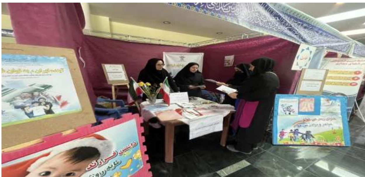
برگزاری مسابقات نقاشی وداستان نویسی ،دارت و کتابخوانی در هفته ملی جمعیت ویژه دانش آموزان ،دانشجویان وکارکنان