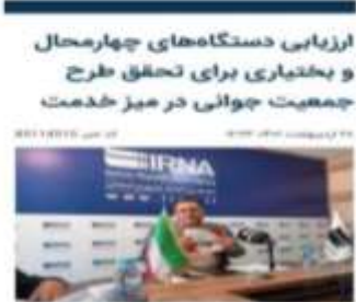
شهرکرد - ایرنا - معاون بهداشت دانشگاه علوم پزشکی چهارمحال و بختیاری و رئیس مرکز بهداشت

شهرکرد - ایرنا - معاون بهداشت دانشگاه علوم پزشکی چهارمحال و بختیاری و رئیس مرکز بهداشت استان با اشاره به اهمیت اجرای قانون حمایت از خانواده و جوانی جمعیت در استان گفت: میزان اجرایی شدن ماده‌های قانون حمایت از خانواده و جوانی جمعیت ۲۹ اردیبهشت‌ماه در عصای امام خمینی (ره) ارزیابی می‌شود.