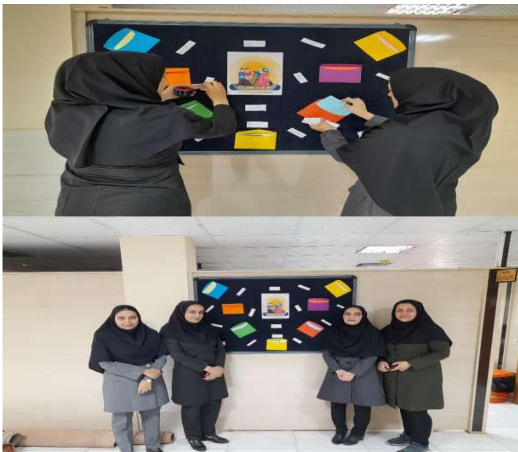
هماهنگی برای استفاده از بیلبردها و نصب بنر برای فضا سازی شهری در راستای جوانی جمعیت