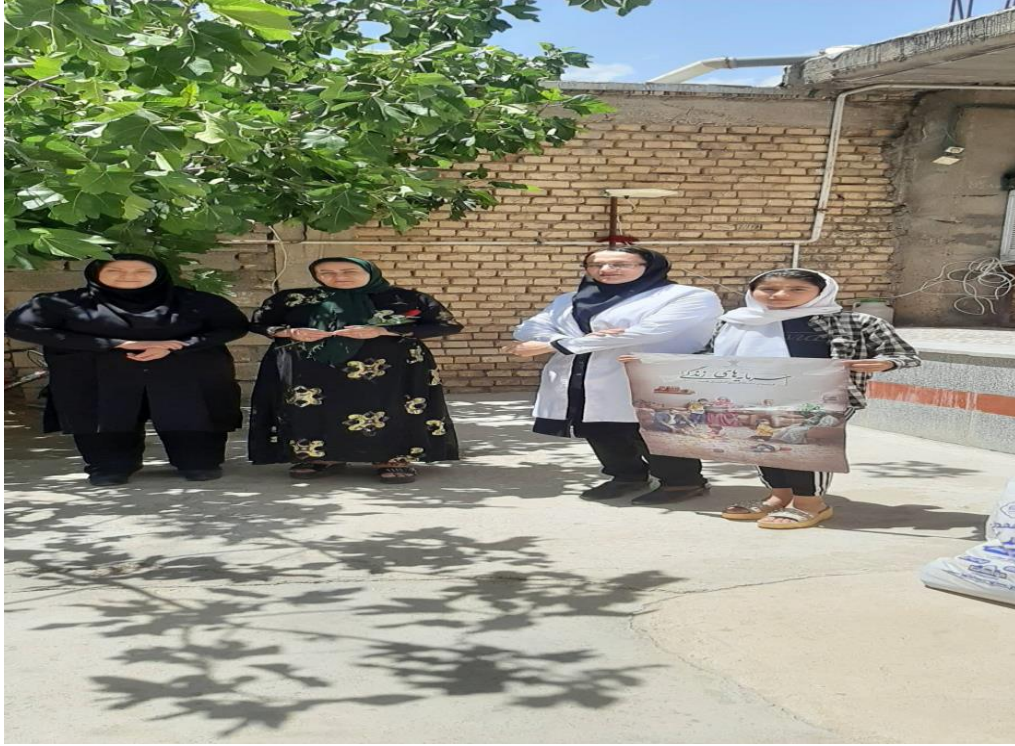
مصاحبه سرپرست محترم شبکه بهداشت و درمان در خصوص جوانی جمعیت